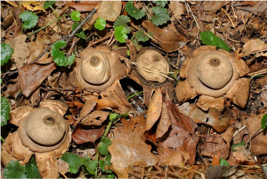
de gekraagde aardsterren stonden massaal langs de weg